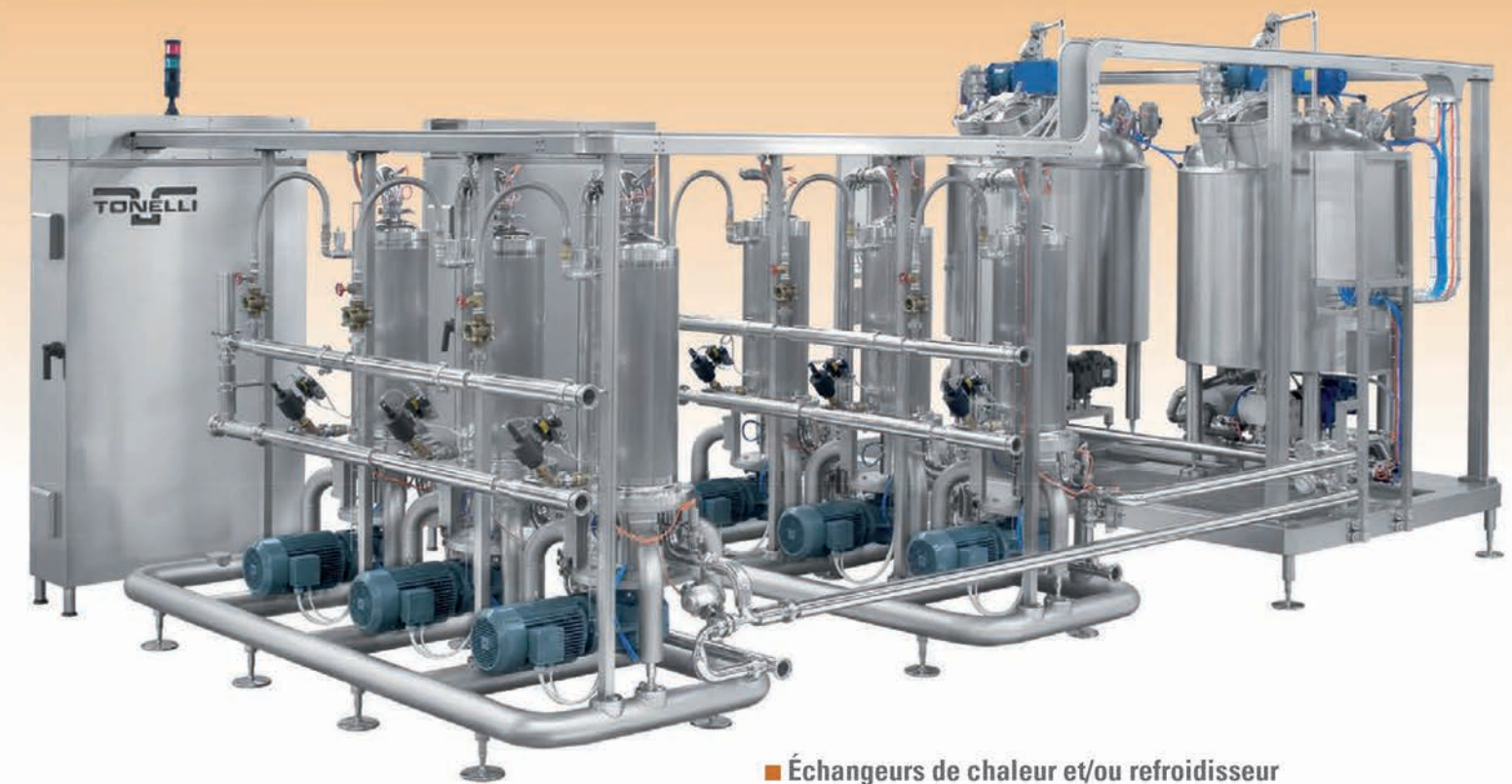
■ Échangeurs de chaleur et/ou refroidisseur