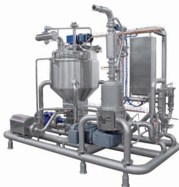
■ Plateforme de réservoir tampon