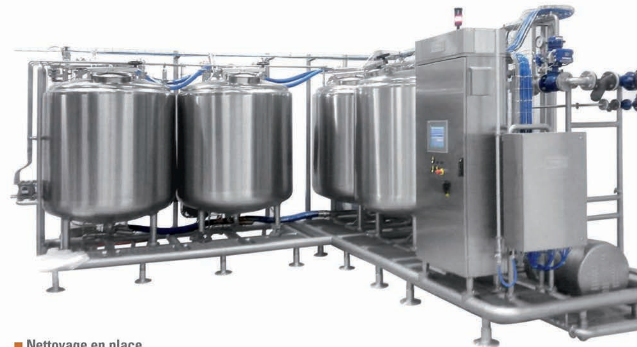
■ Nettoyage en place