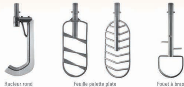
Racleur rond Feuille palette plate Fouet à bras