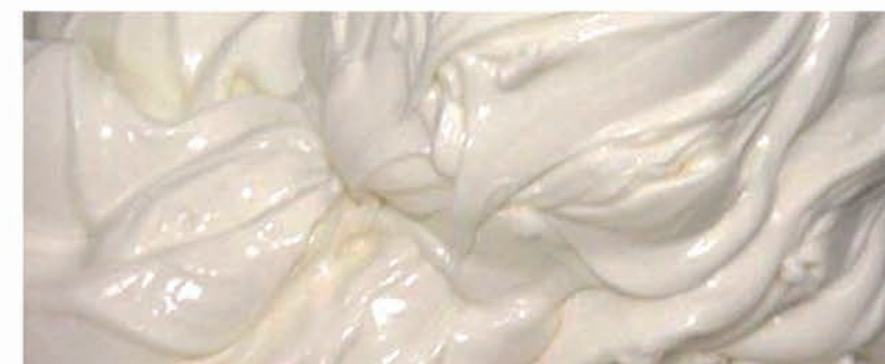
■ Plastification de la matière grasse