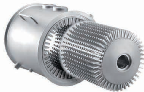
■ Tête interchangeable