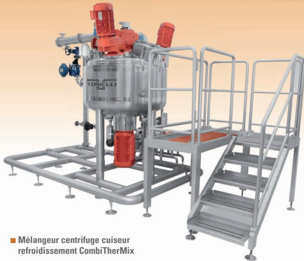
■ Mélangeur centrifuge cuiseur refroidissement CombiTherMix

Mélangeur, cuiseur, homogénéisateur - COMBITHERMIX