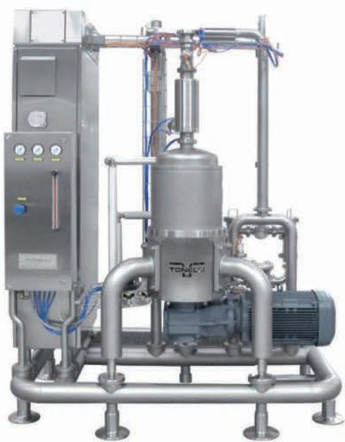
■ Foisonneur en continu