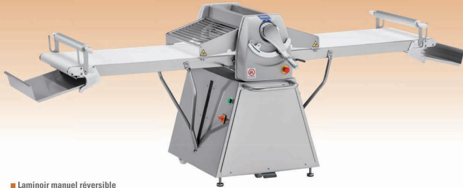
■ Laminoir manuel réversible