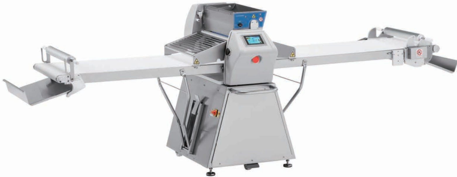
■ Laminoir automatique réversible avec farineur et automate