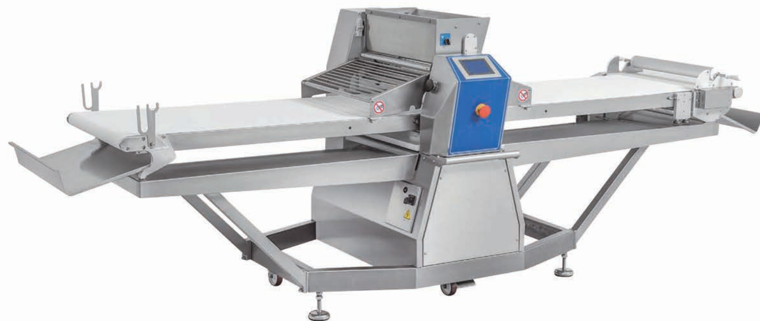
■ Laminoir automatique version structure inox, avec enrouleur à droite (possible à gauche)