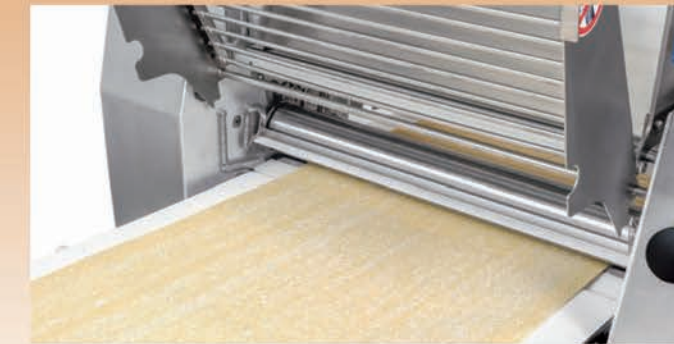
■ Grille de sécurité relevée pour accès racleurs