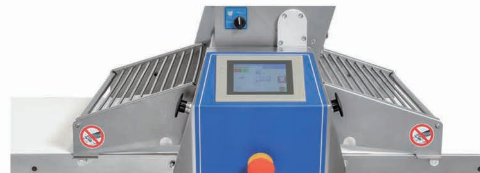
■ Farineur automatique avec grilles de sécurité