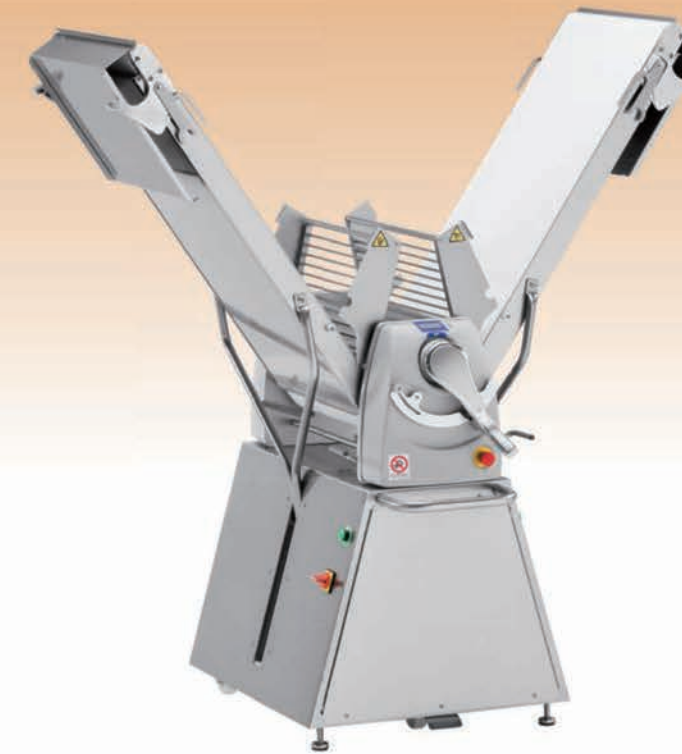
■ Laminoir manuel position relevée