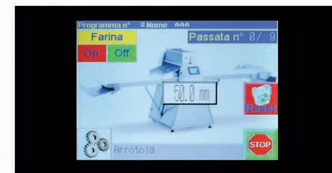
■ Automate programmable