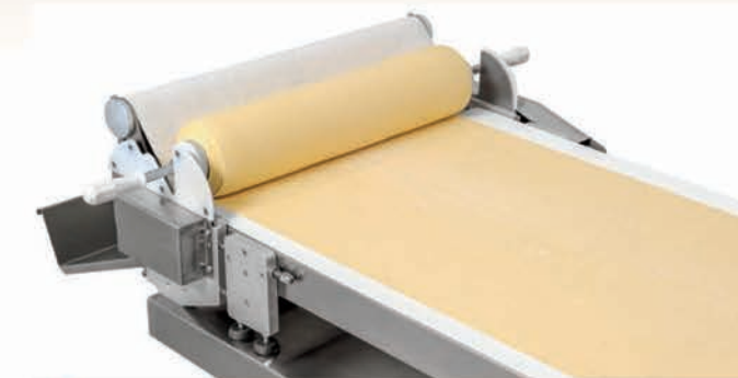
■ Enrouleur automatique