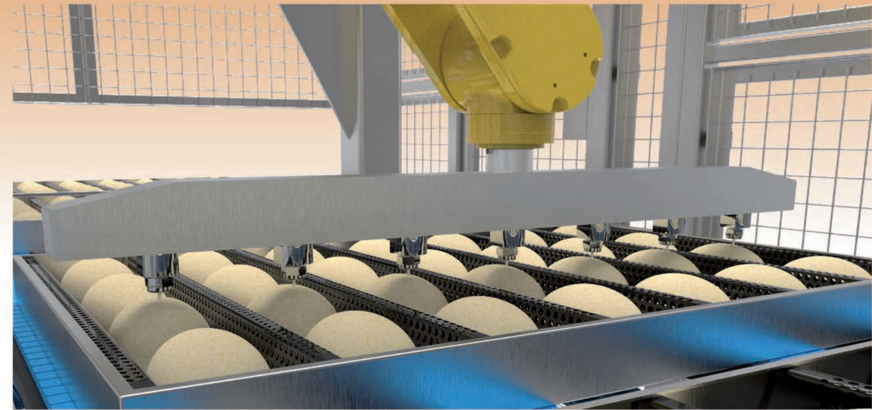
■ Robot de scarification par jet d'eau