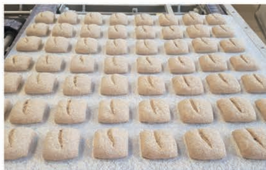
■ Excellent résultat pour tous types de pâtes