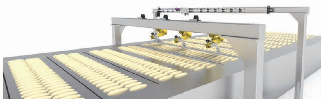
■ Adaptable à votre atelier (après étude)