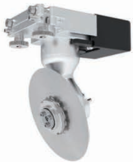
■ Lame rotative de scarification