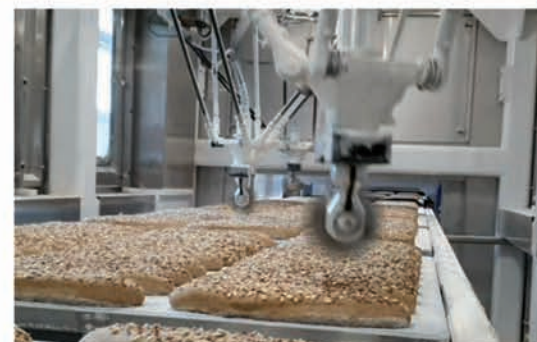
■ Robotique décor de scarification