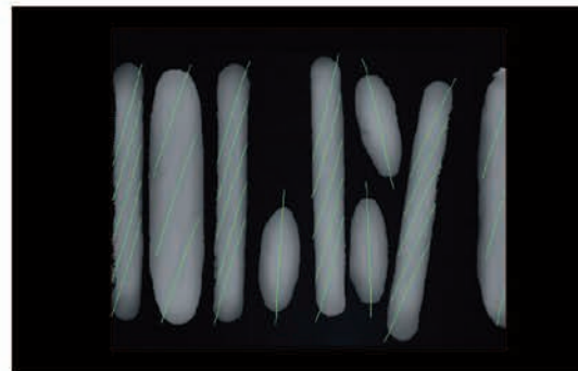
■ Type de pain identifié par caméra (laser)