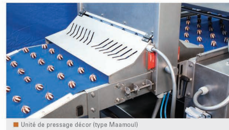
Unité de pressage décor (type Maamoul)