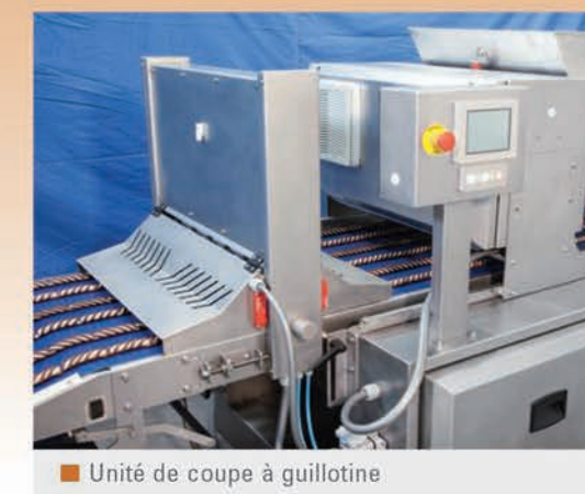
Unité de coupe à guillotine