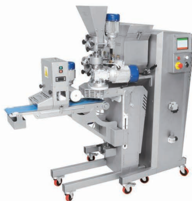
■ Co-extrudeuse à vis NEW MAGIC 2