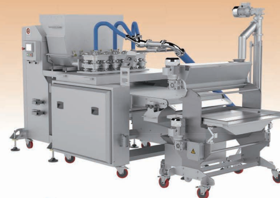
■ Co-extrudeuse à vis MULTILINE 600