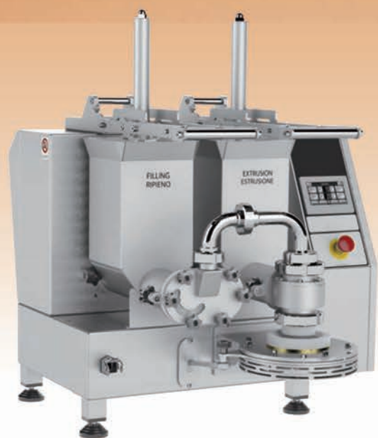
■ Co-extrudeuse à vis PERFETTA à poser sur table