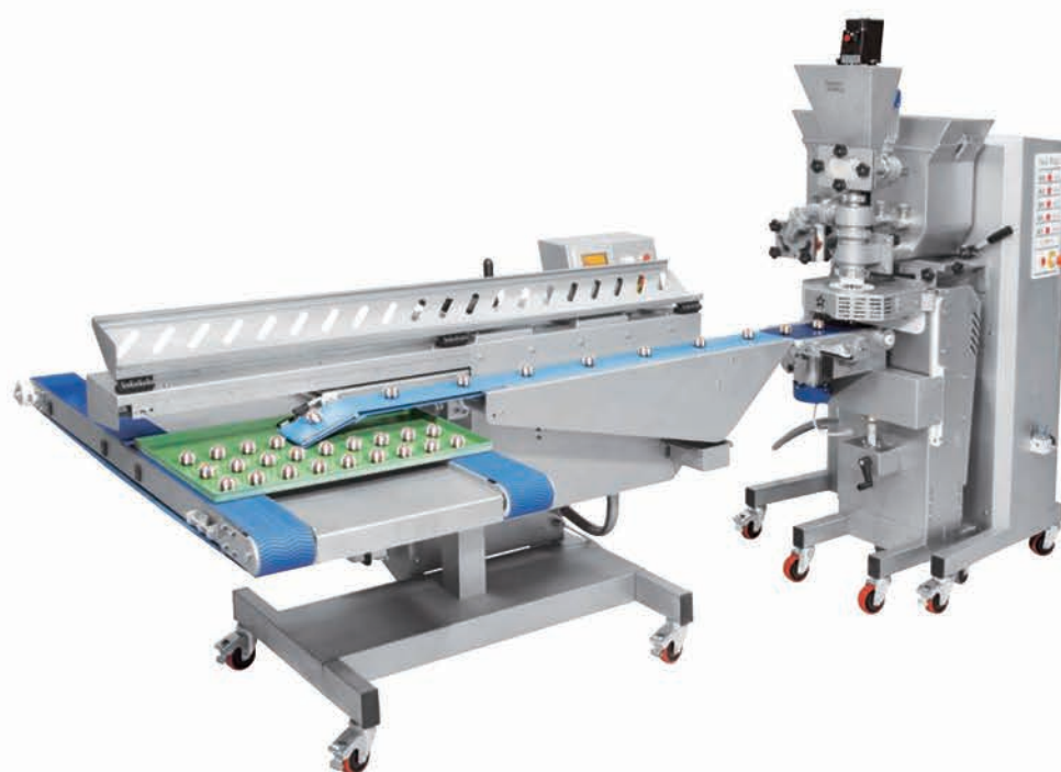
■ Co-extrudeuse à vis NEW MAGIC 2 avec tapis rétractable