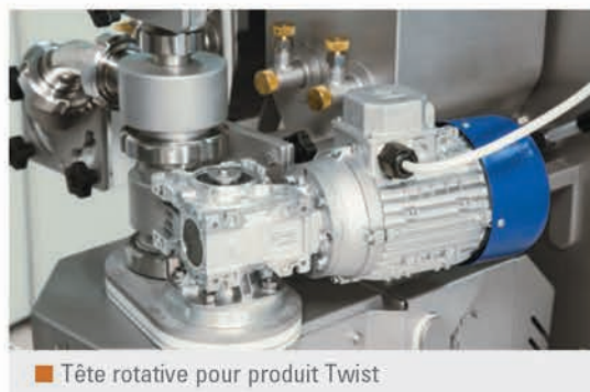
Tête rotative pour produit Twist