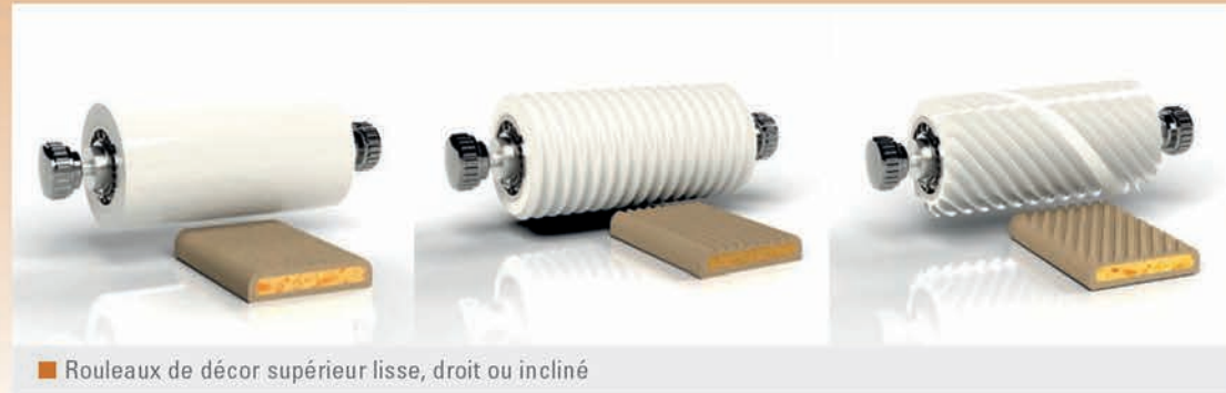
Rouleaux de décor supérieur lisse, droit ou incliné