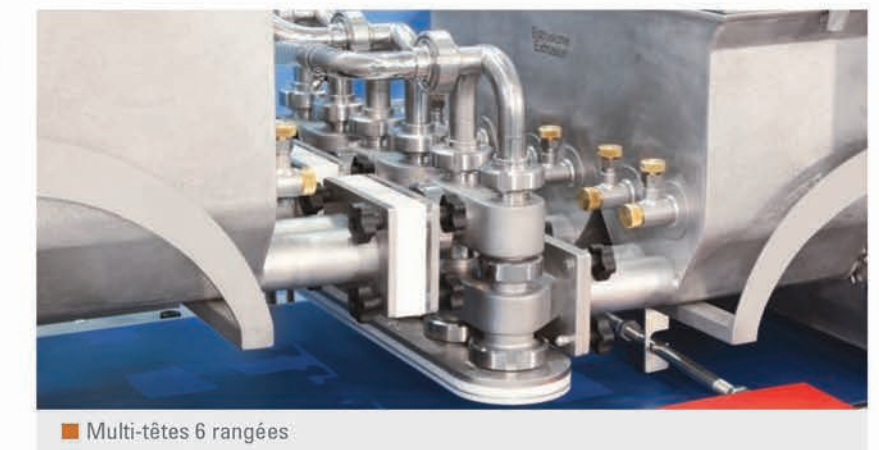
Multi-têtes 6 rangées