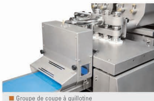
Groupe de coupe à guillotine