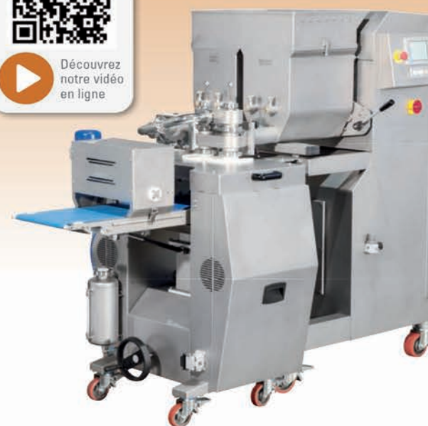
■ Co-extrudeuse à vis NEW FANTASY 80