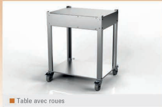
Table avec roues