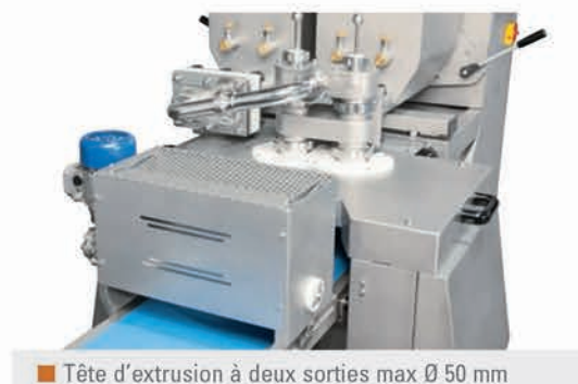
Tête d'extrusion à deux sorties max Ø 50 mm