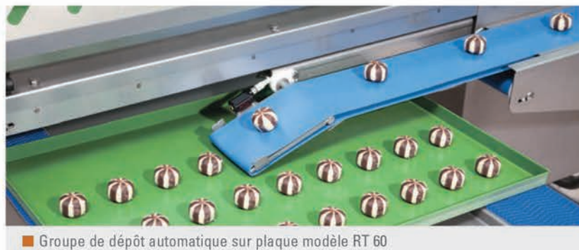
Groupe de dépôt automatique sur plaque modèle RT 60