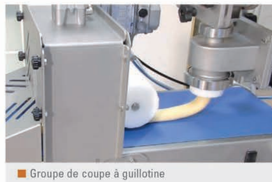
Groupe de coupe à guillotine