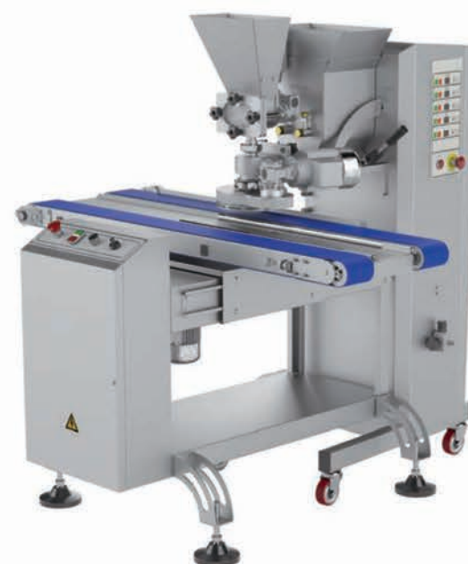
■ Co-extrudeuse à vis NEW MAGIC 1 avec dépose sur plaques