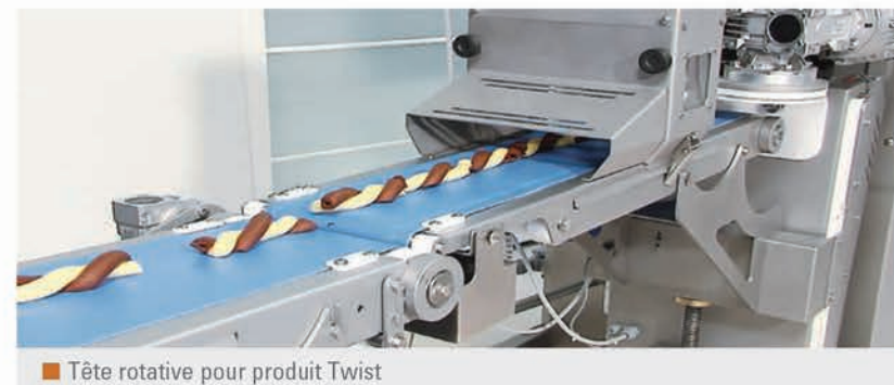
Tête rotative pour produit Twist