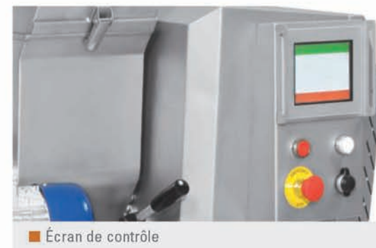
Écran de contrôle