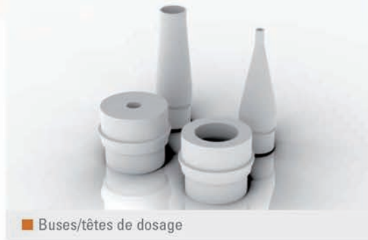
Buses/têtes de dosage