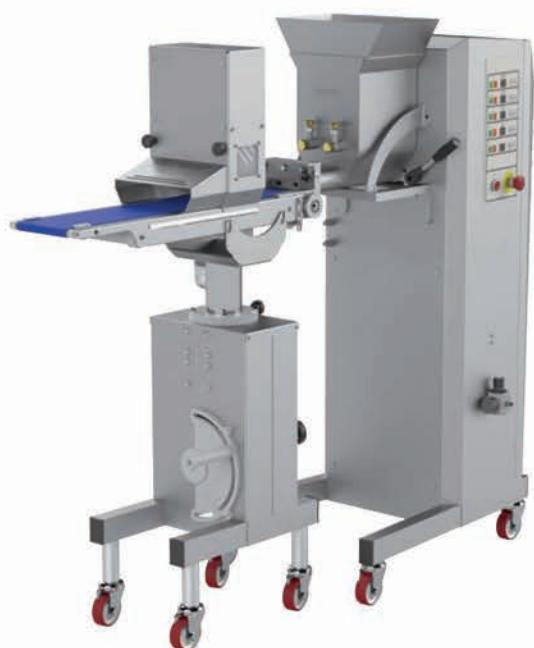
■ Co-extrudeuse à vis NEW MAGIC 1