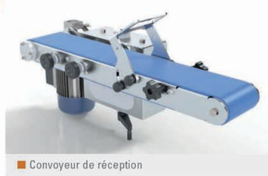
Conveyor de réception