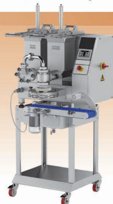
■ Co-extrudeuse à vis PERFETTA