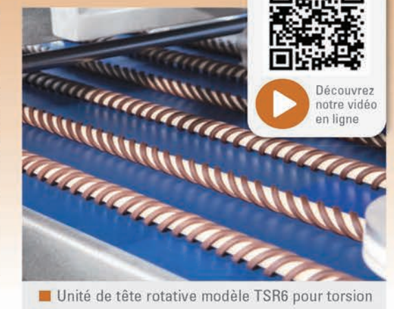
Unité de tête rotative modèle TSR6 pour torsion