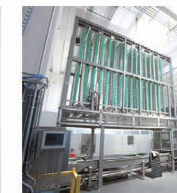
■ Balancelles de repos