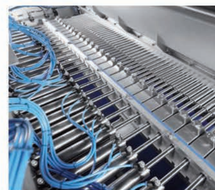
■ Système d'injection volumétrique