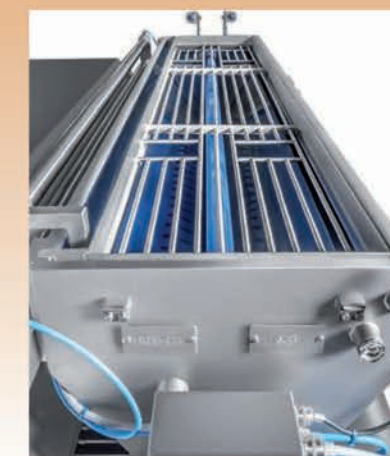
■ Température ajustable dans la trémie