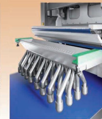
■ Système de dosage produits pâteux