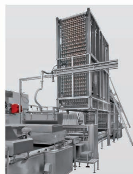
■ Tunnel de refroidissement