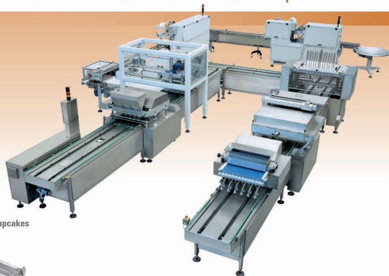
■ Ligne semi-automatique de cupcakes