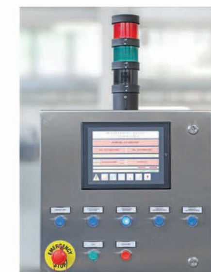
■ Automate configuré selon les spécificités demandées