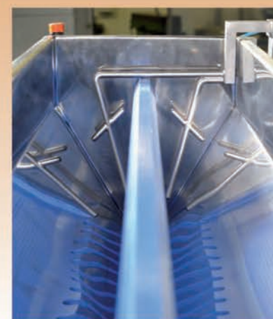
■ Trémie pour deux arômes