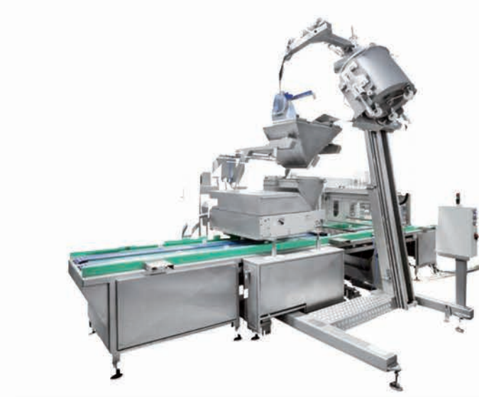
■ Ligne entièrement personnalisable selon spécifications client