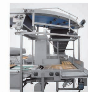
■ Convoyeur de transfert à plateaux