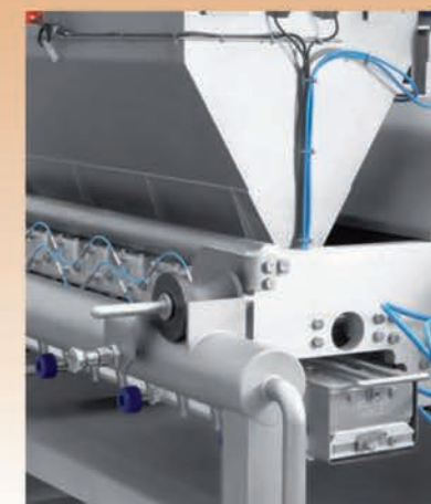
■ Alimentation automatisée et continue de la trémie