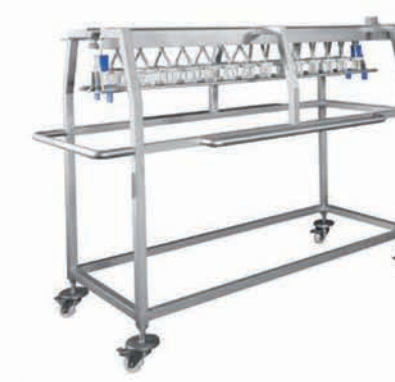
■ Chariot de rangement des têtes de dosage