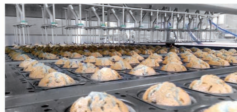
■ Fonctionnement de la ligne complètement automatisé