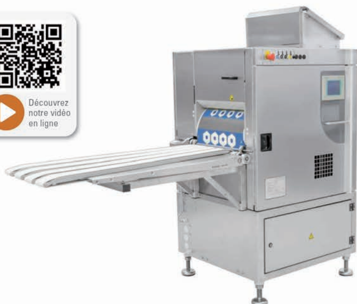
■ CLASSIC REX FUTURA - 3 à 6 rangées