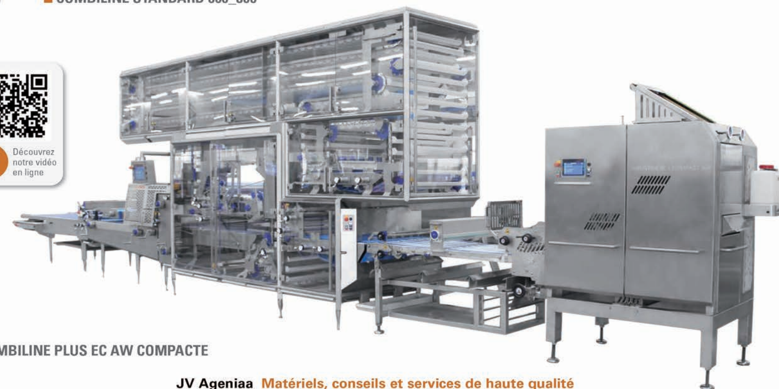
■ COMBILINE PLUS EC AW COMPACTE