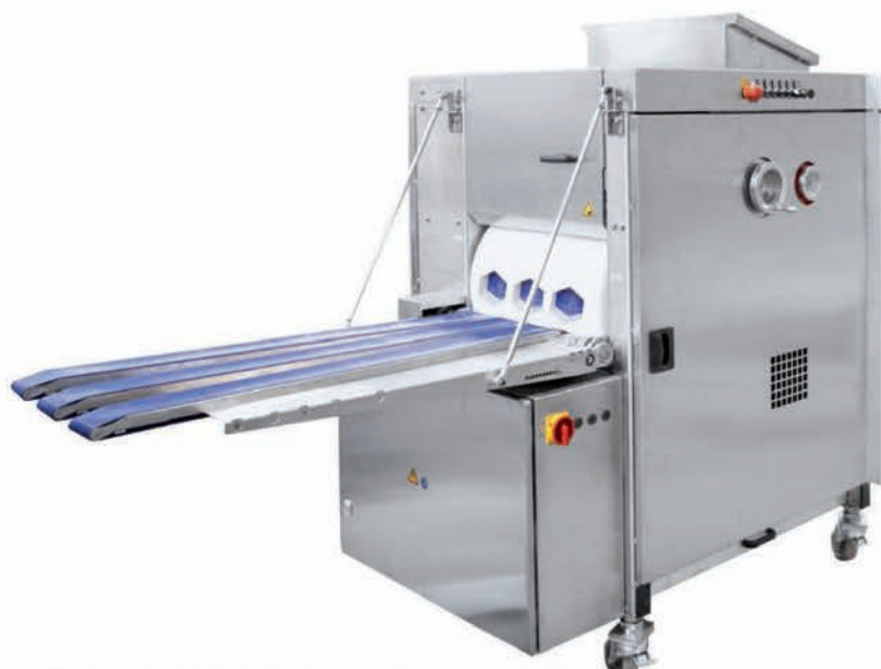
■ GRANDE REX - 3 à 4 rangées