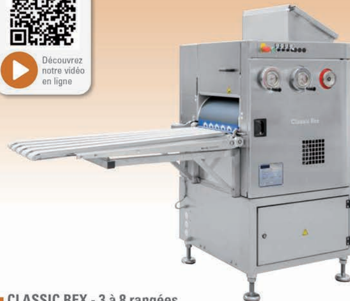
■ CLASSIC REX - 3 à 8 rangées