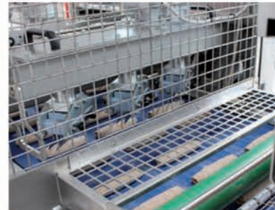
■ Station de scarification