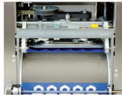
■ Plaque de boulage