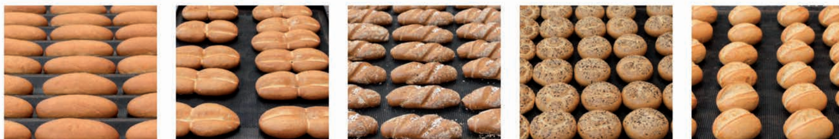
■ Un concept modulaire