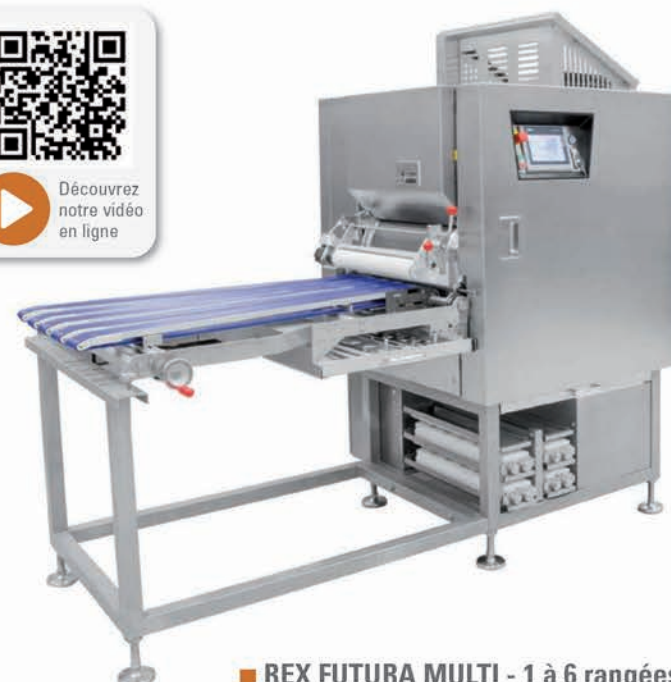
■ REX FUTURA MULTI - 1 à 6 rangées