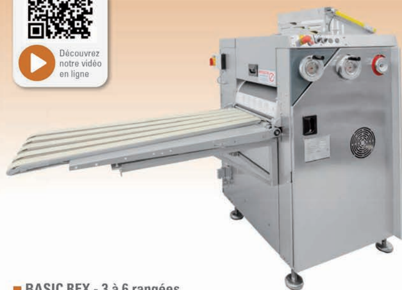
■ BASIC REX - 3 à 6 rangées