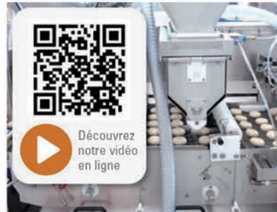
■ Découvrez notre vidéo en ligne