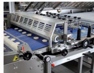
■ Station d'aplatissage