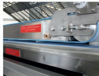
■ Station de façonnage