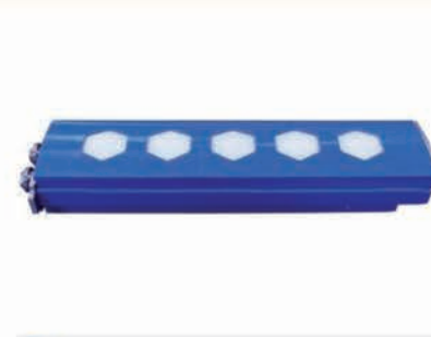
■ Rampe interchangeable MULTI