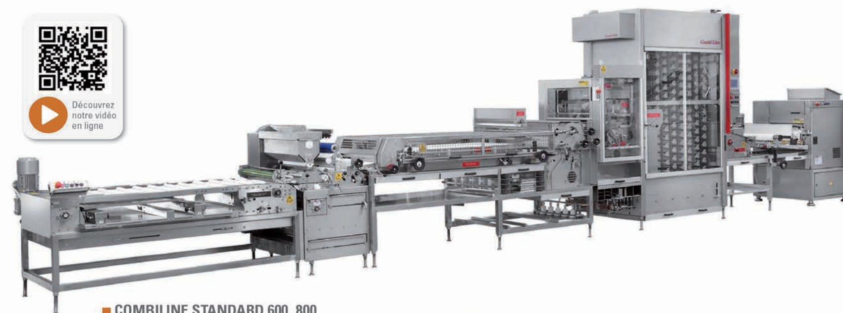
■ COMBILINE STANDARD 600_800