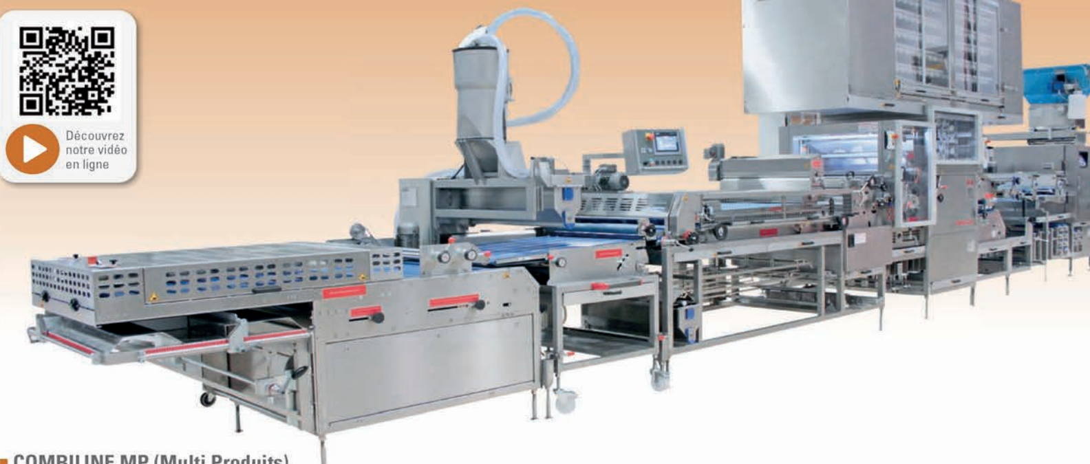
■ COMBILINE MP (Multi Produits)