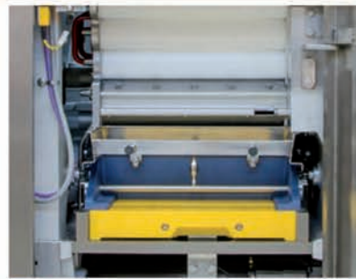
■ Réduction de rangées