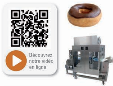
■ Découvrez notre vidéo en ligne