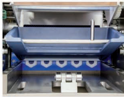
■ MULTI pistons