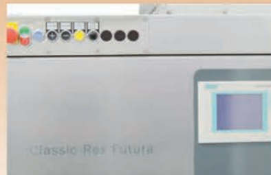
■ Panel opérateur