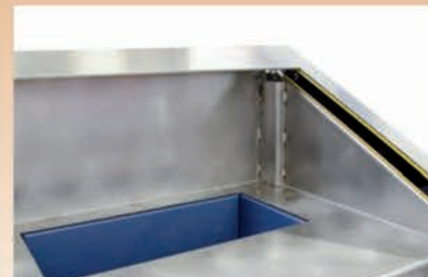
■ Trémie simple de chargement CLASSIC