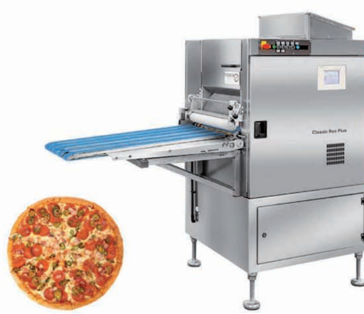
■ CLASSIC REX PLUS - 3 à 4 rangées (spéciale pizza)