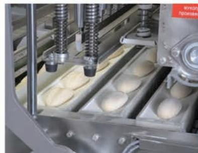
■ Station d'estampillage