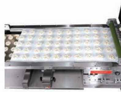
■ Dépose automatique