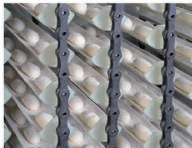
■ Balancelle de repos