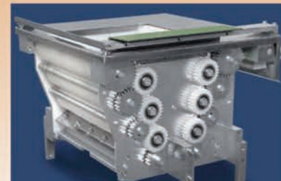
■ Trémie interne TRÖ 50